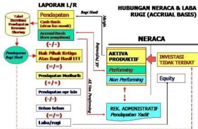
Gambar : hubungan neraca dan laba rugi