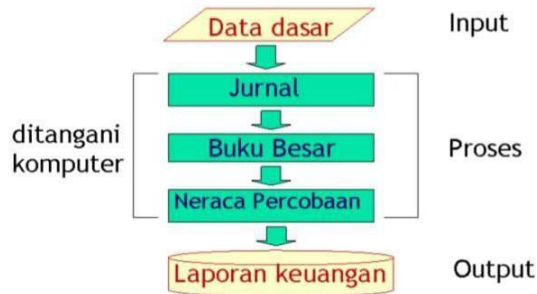
Gambar: - Alur Akuntansi

Jurnal penyesuaian, jurnal penutup dan jurnal koreksi (jika diperlukan) dilakukan pada hari kerja berikutnya atau dilakukan oleh kantor akuntan yang melakukan pemeriksaan atas laporan keuangan tersebut (Harahap 2005)